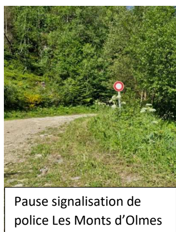
Pause signalisation de police Les Monts d'Olmes