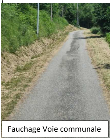
Fauchage Voie communale

Cette année encore, les agents municipaux ont embelli notre commune et créé un environnement accueillant et coloré. Que ce soit dans l'entretien des espaces verts, l'arrosage des fleurs ou la mise en place des décorations saisonnières, leur rôle est essentiel. Bravo pour leur engagement et leur contribution à la beauté de notre village ! 😊🌸🌿