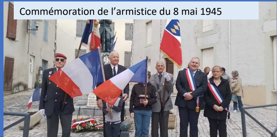
Commémoration de l'armistice du 8 mai 1945

23/06 : Les Joyeux Cantaires, une chorale d'hommes venue dans notre village. Leur répertoire est aussi varié que captivant : des chansons d'hier et d'aujourd'hui, des airs folkloriques, des cantiques, des extraits d'opéras, des chants patriotiques, ainsi que des chansons humoristiques et paillardes. Leurs voix masculines ont résonné, apportant joie et harmonie à la communauté locale. Une belle initiative qui mérite d'être célébrée ! 🎵😊