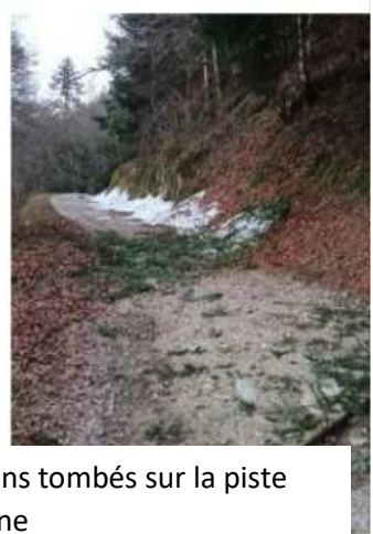
Avant/Après - Suite aux fortes rafales de vent, sapins tombés sur la piste forestière accédant à Moulzoune