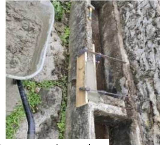
Préservation des lavoirs : un héritage communal restauré Réfection du lavoir du Saou