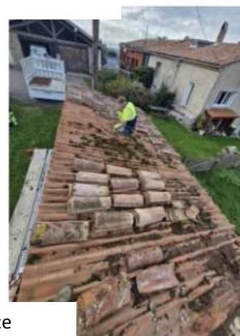
Réfection toiture du lavoir du col de la Lauze