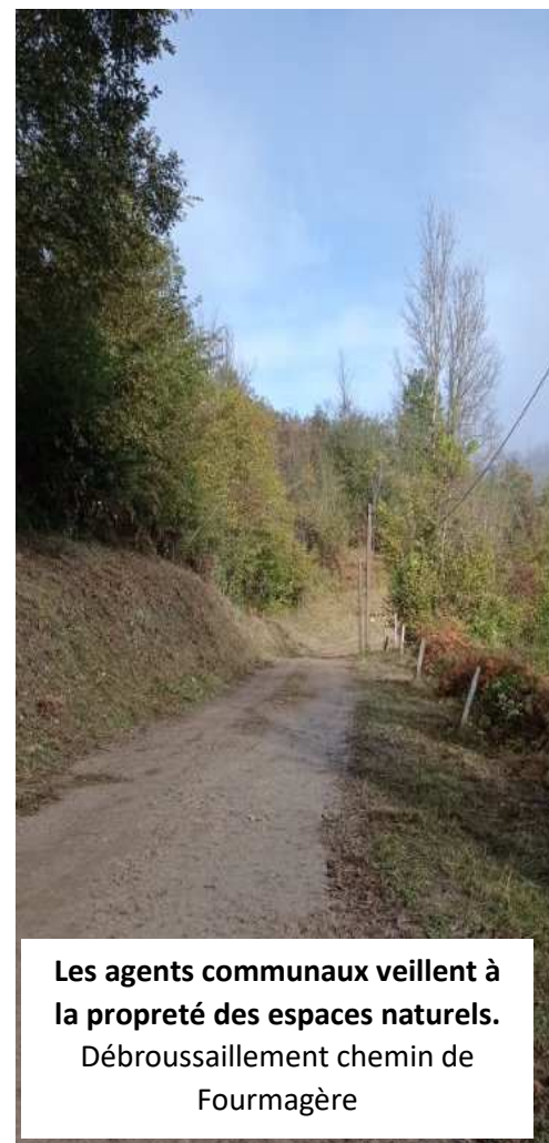
Les agents communaux veillent à la propreté des espaces naturels. Débroussaillage chemin de Fourmagère