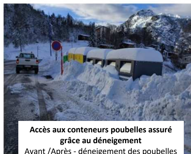
Accès aux conteneurs poubelles assuré grâce au déneigement Avant /Après - déneigement des poubelles Mont d'Olmes