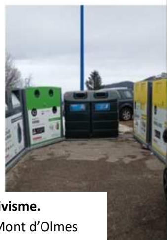
Les agents communaux en action contre l'incivisme. Avant/Après - Ramassage des poubelles aux Mont d'Olmes